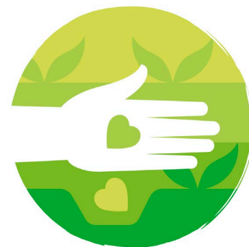
DUURZAME LANDBOUW & VOEDSELPRODUCTIE