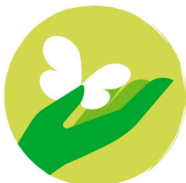
NATUUR & LANDSCHAP